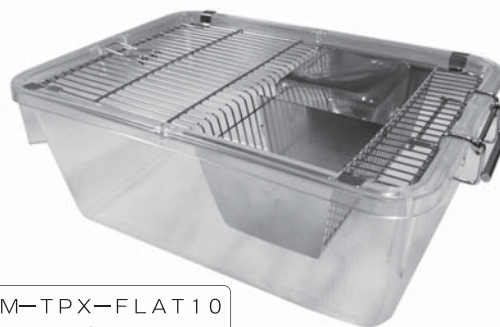
型式：TM-TPX-FLAT10 TPX樹脂製ケージです オートクレーブ滅菌に最適です