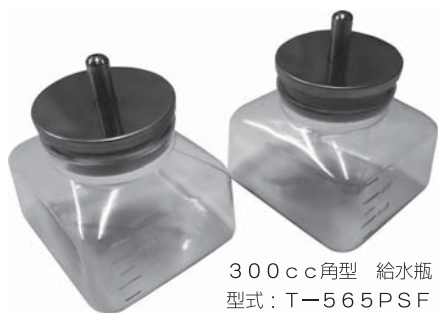
300cc角型 給水瓶【PSF製】 型式：T-565PSF

ラックの収容ケージ数を増す為、蓋に凹部を設け 角型給水瓶を差し込み、総高さ寸法を低くしたケージです。 角型給水瓶は蓋の凹部にぴったり収まる300cc給水瓶です。