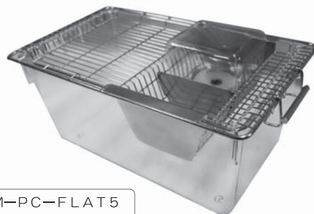
型式：TM-PC-FLAT5 ポリカーボネイト製ケージです