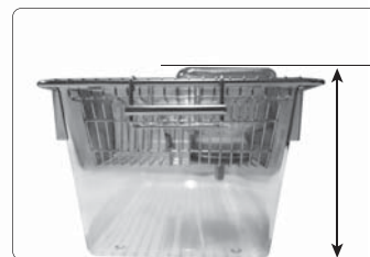
給水瓶使用時総高さ